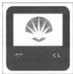
Casa de Labranza