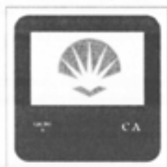
Casa de Aldea